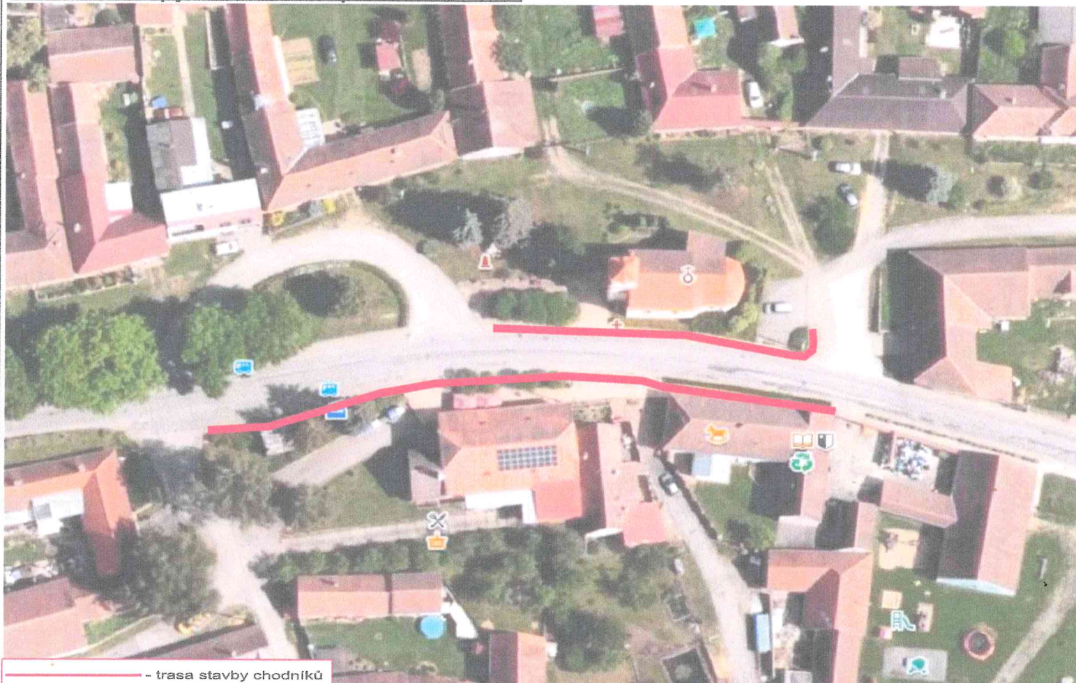
— - trasa stavby chodníků